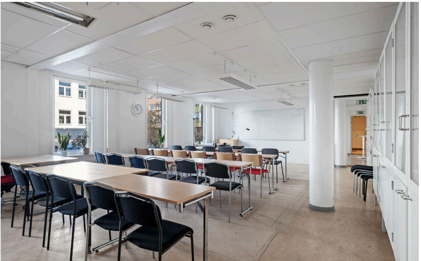
Fastighetens entré och lärosal.