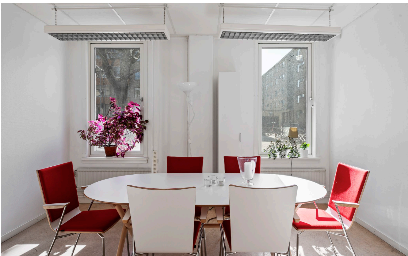
Allmän yta och konferensrum.