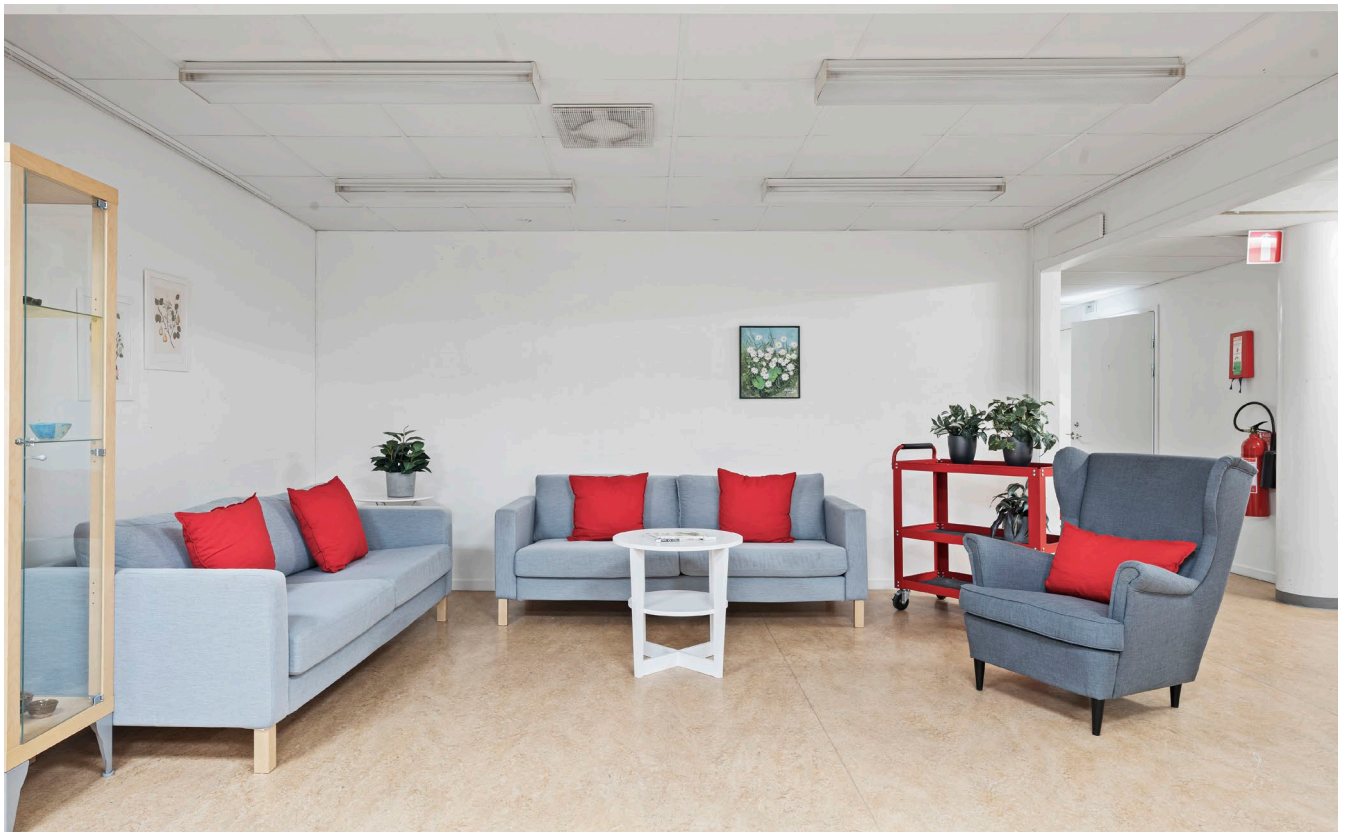
Kontorsrum och lounge.